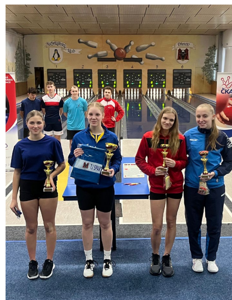
Medailistky ze sprintu