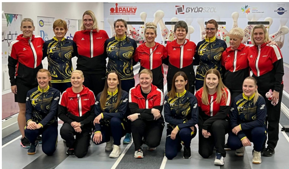
Domácí výhra pomohla BBSV Wien k postupu v Lize mistrů