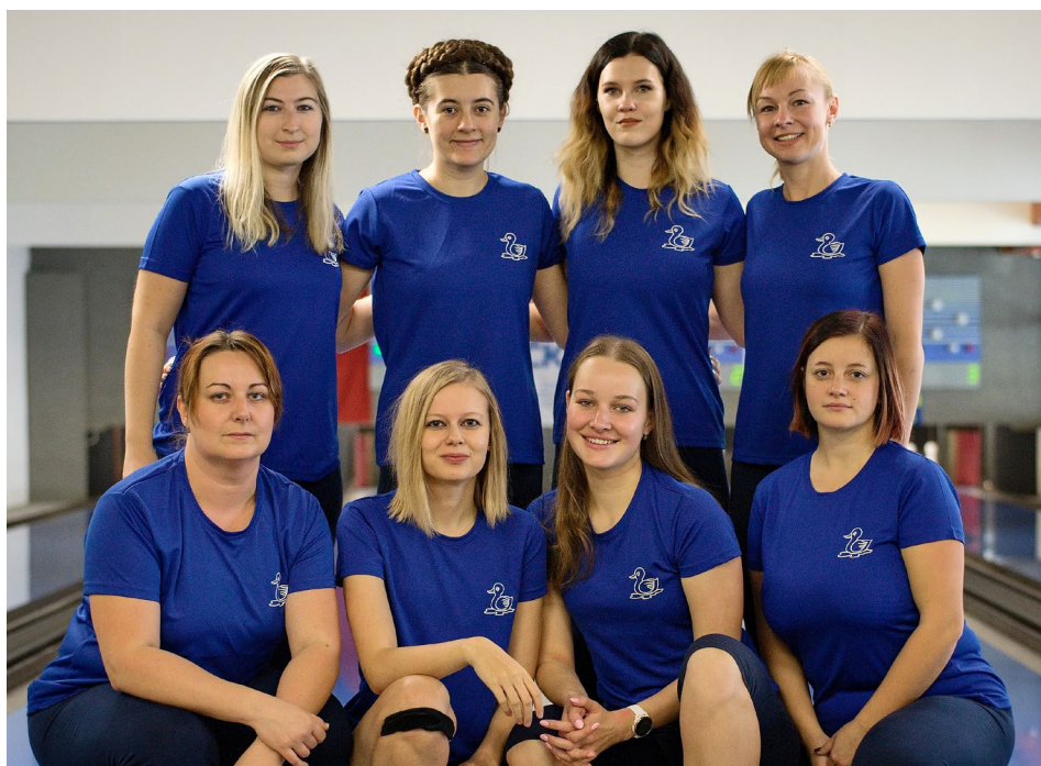
Čtvrtá Jihlava může na jaře útočit na medailové příčky