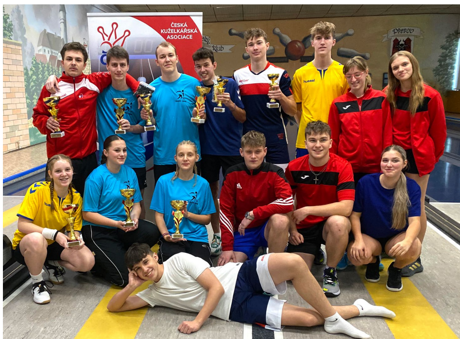
Karlovarský kraj si odvezl nejcennější trofeje z týmové soutěže