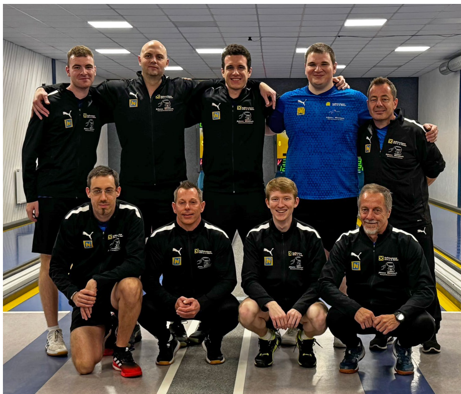
Orth zdolal Zadar a těší se na Podbrezovou