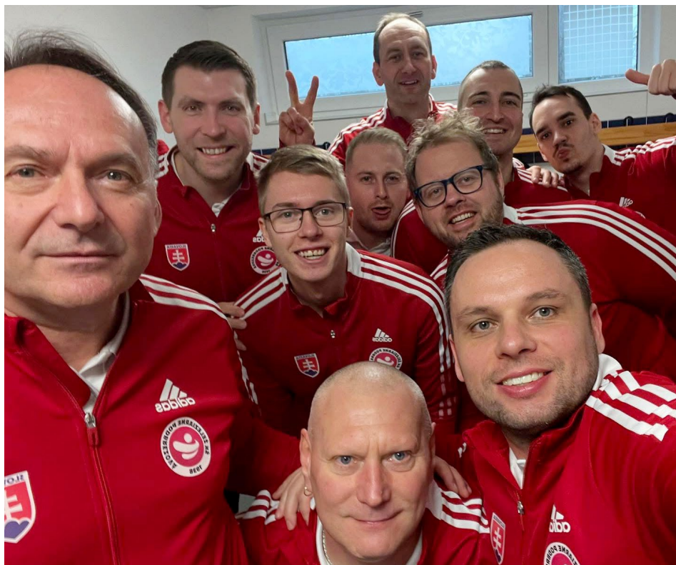
Podzimním králem je Podbrezová