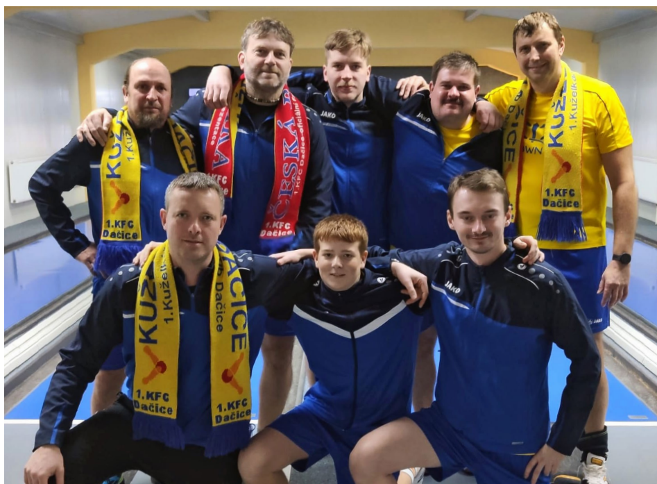
Dačice na podzim zahrály tři nejlepší výkony soutěže