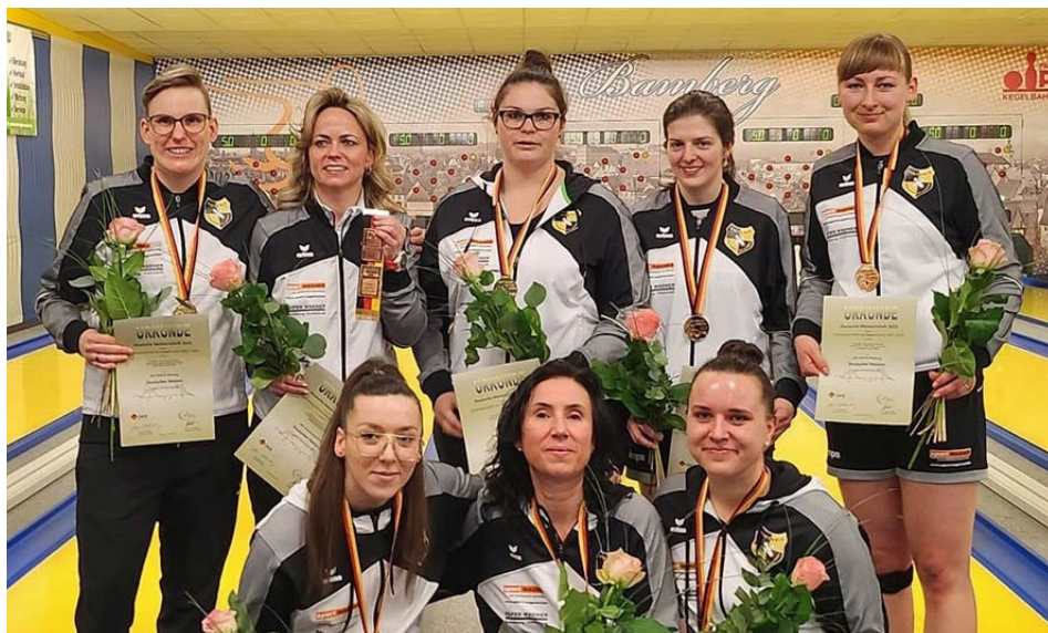
V Evropě druhé, na domácí půdě suverénní; Bamberg slaví další titul

Bronzovou pozici obsadil VfB Hallbergmoos Goldach, jeho hráči si po polovině soutěže mohli dělat zálsuk i na prvenství, měli shodný počet bodů jako Zerbst. Jenže jarní část se jim vůbec nevydařila. Z devíti utkání odcházeli hned čtyřikrát poraženi,