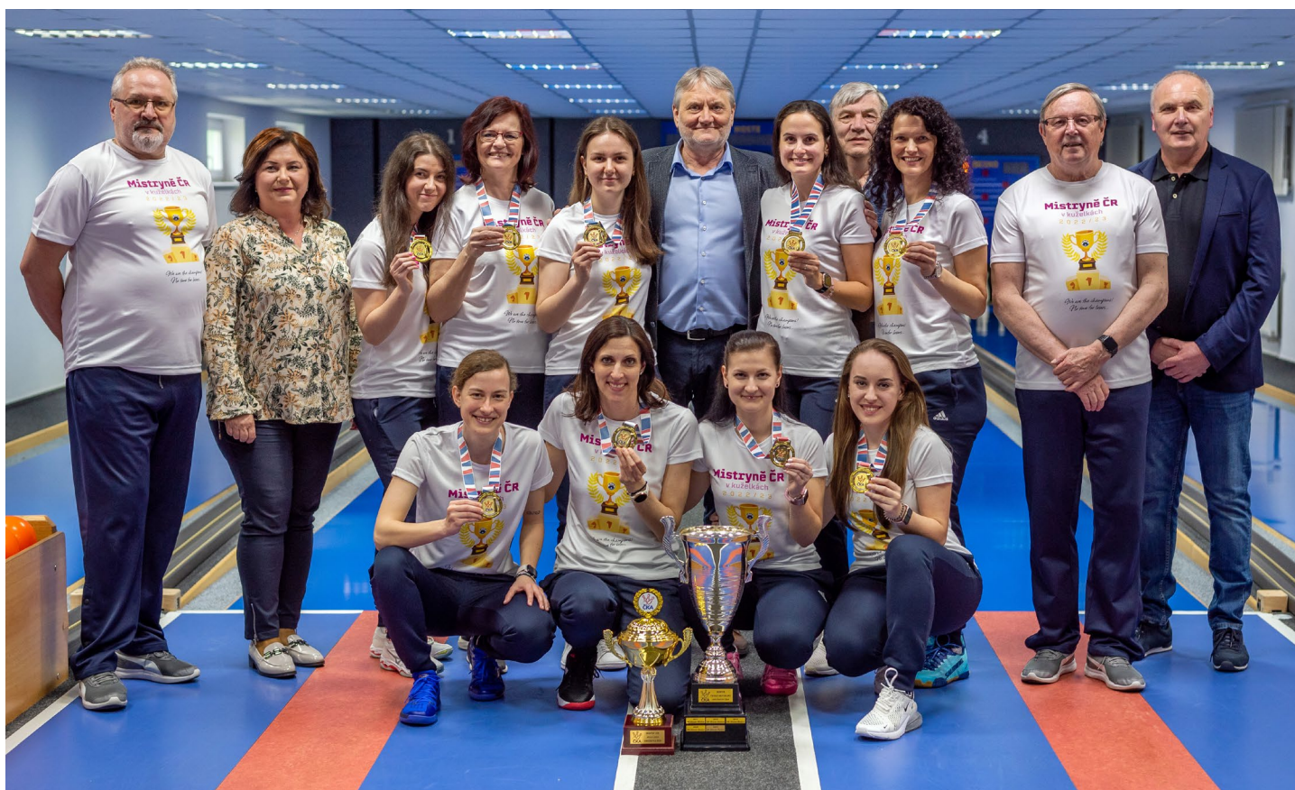
Slovan Rosice si suverénně dokrâčel k dalšímu titulu mistra ČR