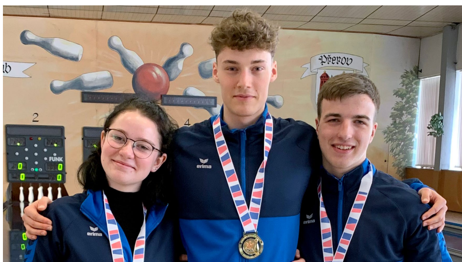
Zástupci Sokola Kdyně dominovali ve finále KLD