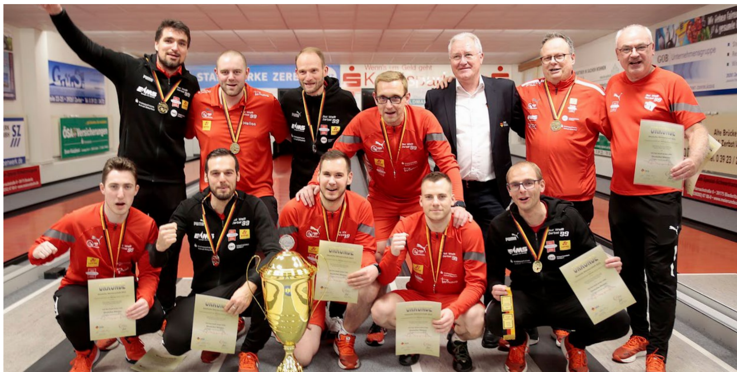
Hvězdná sestava Zerbstu s pohárem pro německého mistra