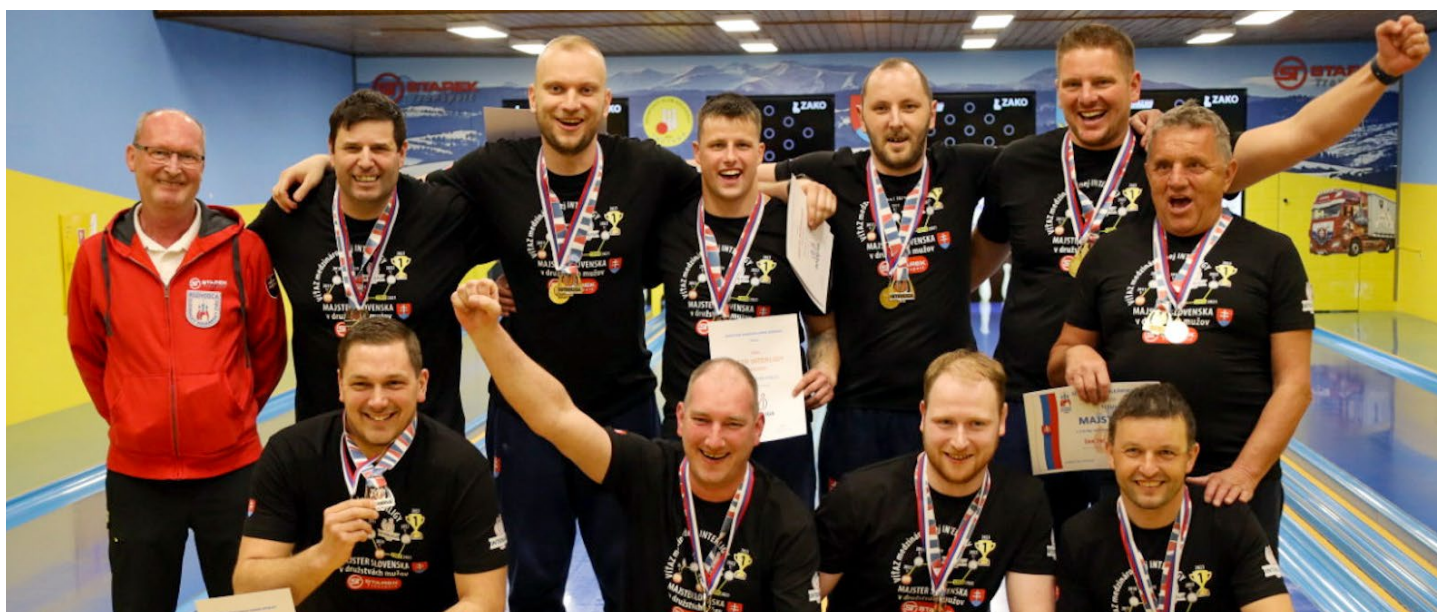
Mistrovská radost Trstené