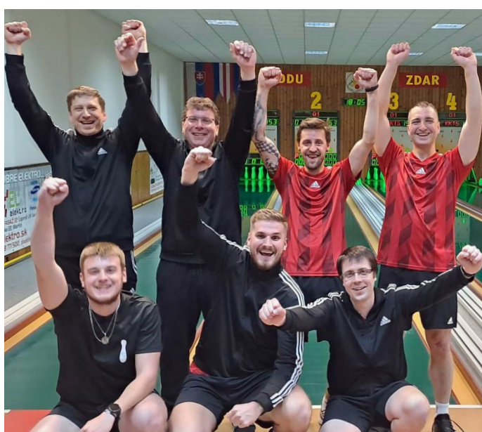
Stříbro putuje na Valašsko