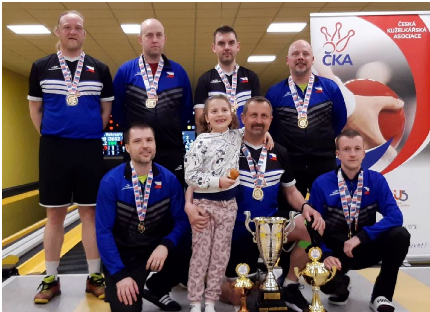
Rokycany slaví obhajobu českého titulu