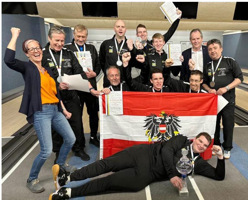
Hráči Orthu ze stříbrných medailí rozhodně nesmutnili