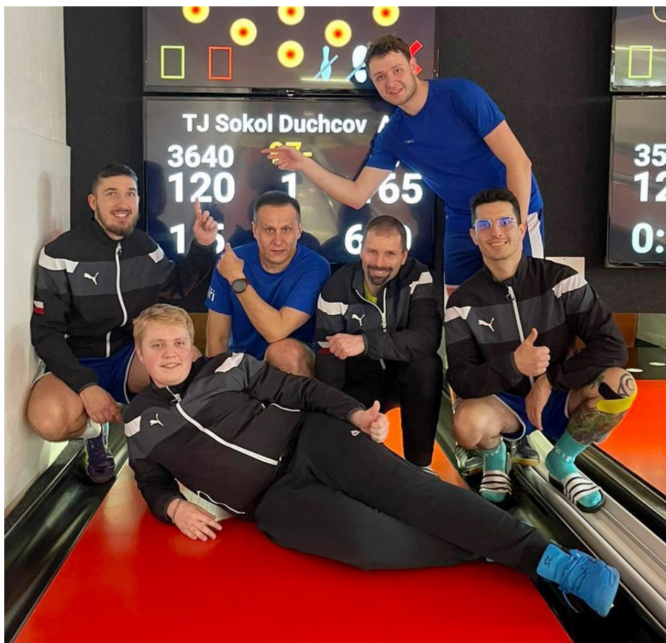
Moment z utkání proti Zábřehu, ve kterém Duchcov docílil týmového rekordu (3640)

Na stříbrné příčce ukončil svoje letošní působení KK Zábřeh. Zábřeh strávil na čele většinu jarní části, nezvládl však klíčová venkovní utkání v Přelouči (Sadská) a Duch-