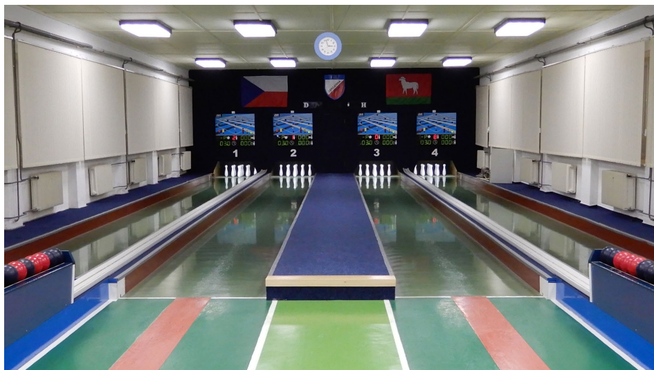
Aktuální podoba čtyřdráhové kuželny ve Vsetíně