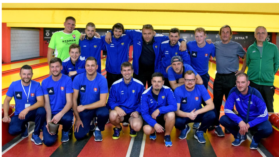
Společná fotografie týmů Jihlavy a slovenské Trstené