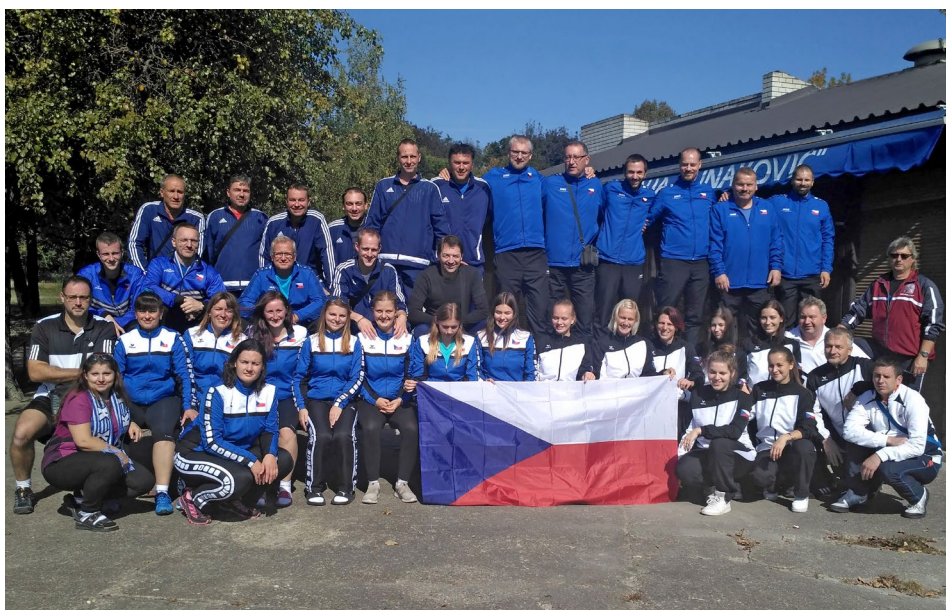
Společná fotografie českých družstev na Poháru NBC 2018

Tímto výkonem také stanovil náš konečný výkon na celkem slušných 3378. Tento součet nám pak stačil k posunu na konečné 15. místo. Za sebou jsme nechali již shora uvedené týmy Estonců či oba Francouze, ale také např. klub z domácího Srbska či oba interligové účastníky Husovice a Velký Šariš. Takže jsme odjížděli ze Srbska s dobrými pocity, a hlavně vztyčenou hlavou.