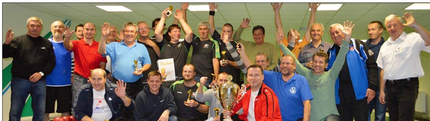
Společná fotografie kuželkářů na 7. Mezinárodním mistrovství neregistrovaných na čtyřdráze ve Valticích