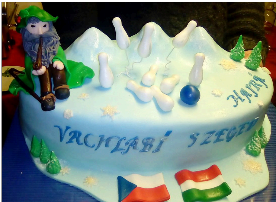
Dort připravený pro utkání Ligy mistrů Vrchlabí vs. Szeged