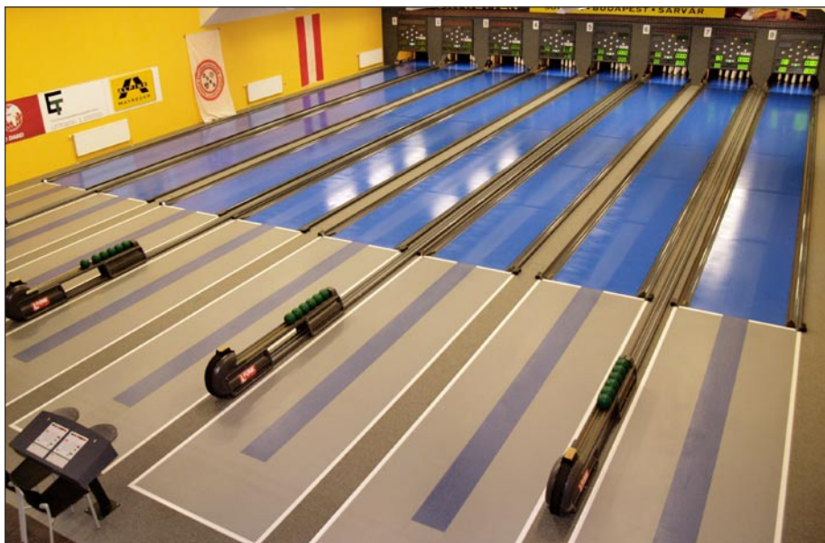
Osmidráha dějiště mistrovství světa v rakouském Ritzingu