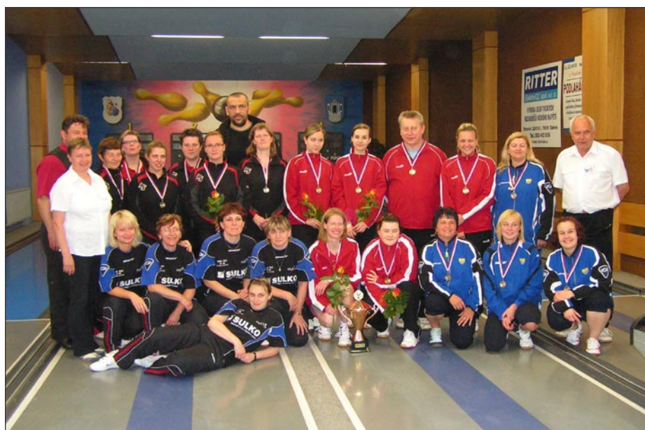
Společné foto družstev žen v Zábřehu

Jihlavanky tak zdárně otočily průběh souboje o třetí místo. Zvítězily 4:2 2145:2128. Domácímu Zábřehu tak zby-