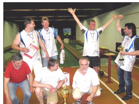
Radost vítězů byla nefašovaná

Druhý den sice třístovka nepadla, ale chybělo málo. Padla jedna celková jedenáctistovka, která se projevila jako rozhodující a vítězná. Propadli však obhájci soutěže Uzli z Přerova, kteří vybuchli hlavně v dorážce, byť těch chyb měli málo. Zklamání byli i další Přerováci, kteří neprodali v nich ukrytý potenciál. Určité zklamání bylo čtvrté místo domácích, hlavně proto, že odstupují z amatérského koulení a chtějí