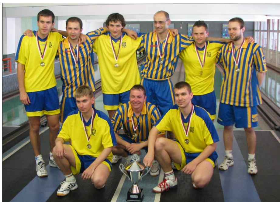
Hráči KK PSJ Jihlava a TJ Spartak Přerov