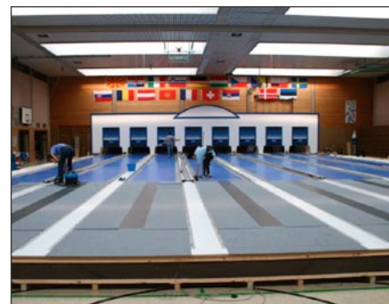
Příprava drah v Dettenheimu