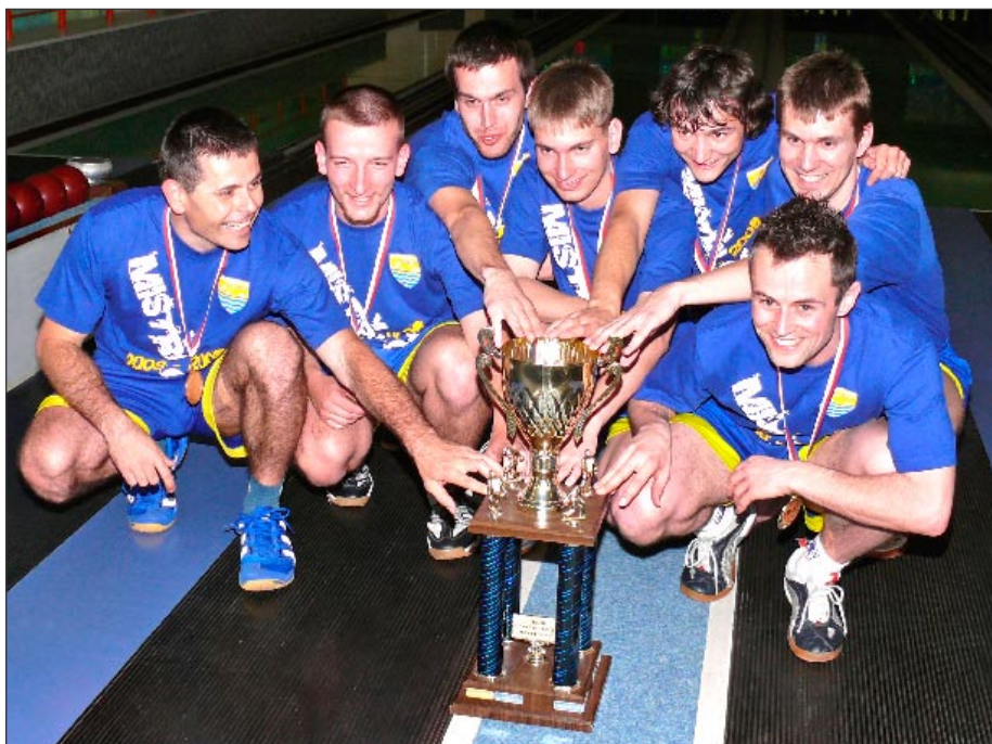
Mistr České republiky 2009 – družstvo mužů KK PSJ Jihlava