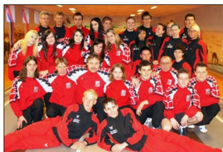
Společné foto účastníků přátelského utkání

Naši výpravu tam přivítala nádherná, ale velice těžká kuželna. Pro trenéry to byla jedna z posledních možností prověřit své „ovečky“ před blížícím se MS dorostu, které se uskuteční 7.–13. 5. 2009 v německém Dettenheimu.