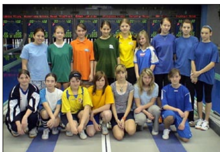
Finále Poháru mladých nadějí – starší žákyňe

V sobotu 28. března přivítala olomoucká osmidráha finalisty letošního 13. ročníku Poháru mladých nadějí. Již tradičně naplněné hlediště sledovalo boje nejen o celkové vítězství, ale i o třináct postupových míst na mistrovství republiky v kategorii starších žáků a starších žákyň.