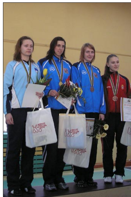
Medailistky na stupních vítězů

HW: Kuželna vcelku byla dobře připravená, měli nové koule, po každé stodvacítce to mazali, až na ty kuželky,