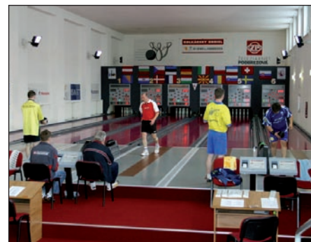
Kuželna v Podbrezové