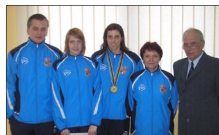
Úspěšná česká výprava na SPJ 2008