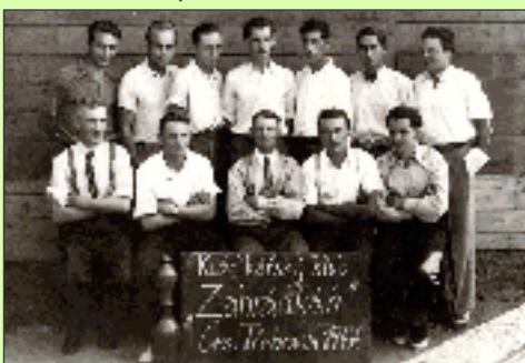
Nejstarší dochovaná fotografie je z roku 1947, kdy se nechali vyfotit členové Kuželářského klubu Zahrádkáři Č. Třebová

Jelenice: „Zahrádkáři“, KO DTJ, Sokol ČSD „B“.