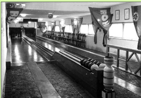
Dvoudráha Lokomotivy v roce 1953 Čtyřdráha s novými ASK v roce 2006